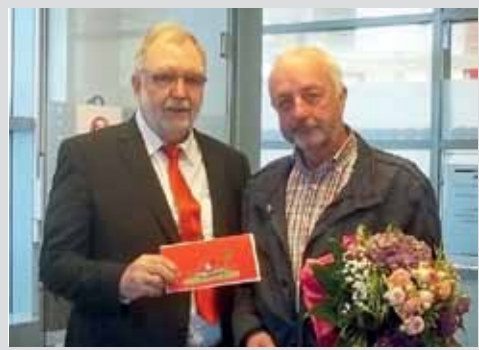
Hauptgewinne bei Sparkassen-Lotterie Seite 5