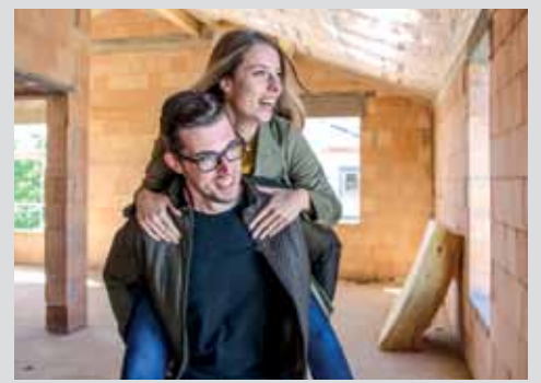
Bauen & Renovieren: Geldwertes Wissen für Eigentümer Seite 6